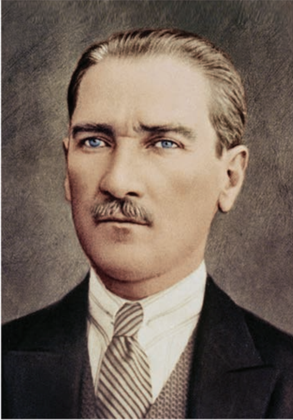
Mustafa Kemal ATATÜRK Türkiye Cumhuriyetinin Kurucusu