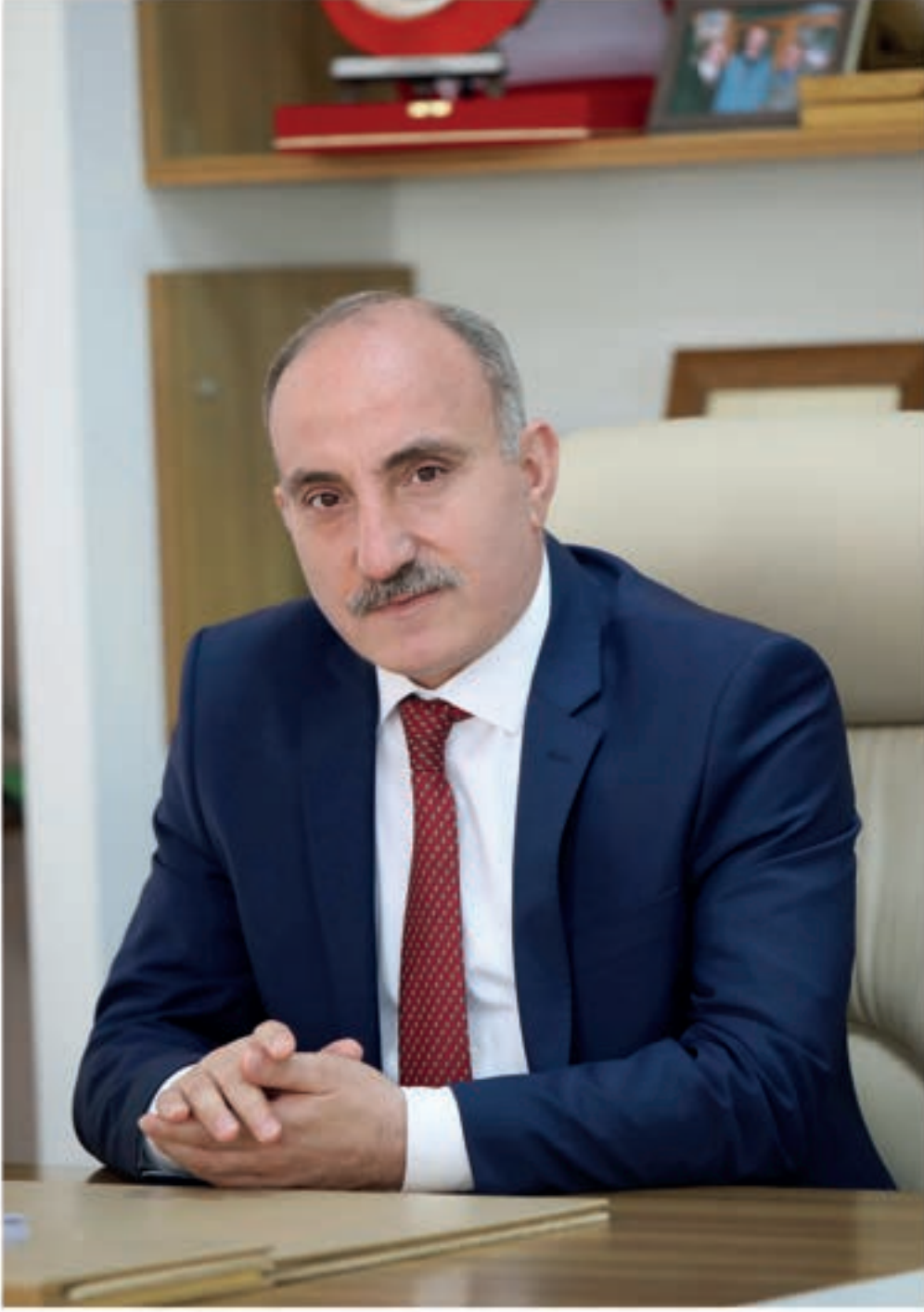
Fevzi KILIÇ Erenler Belediye Başkanı