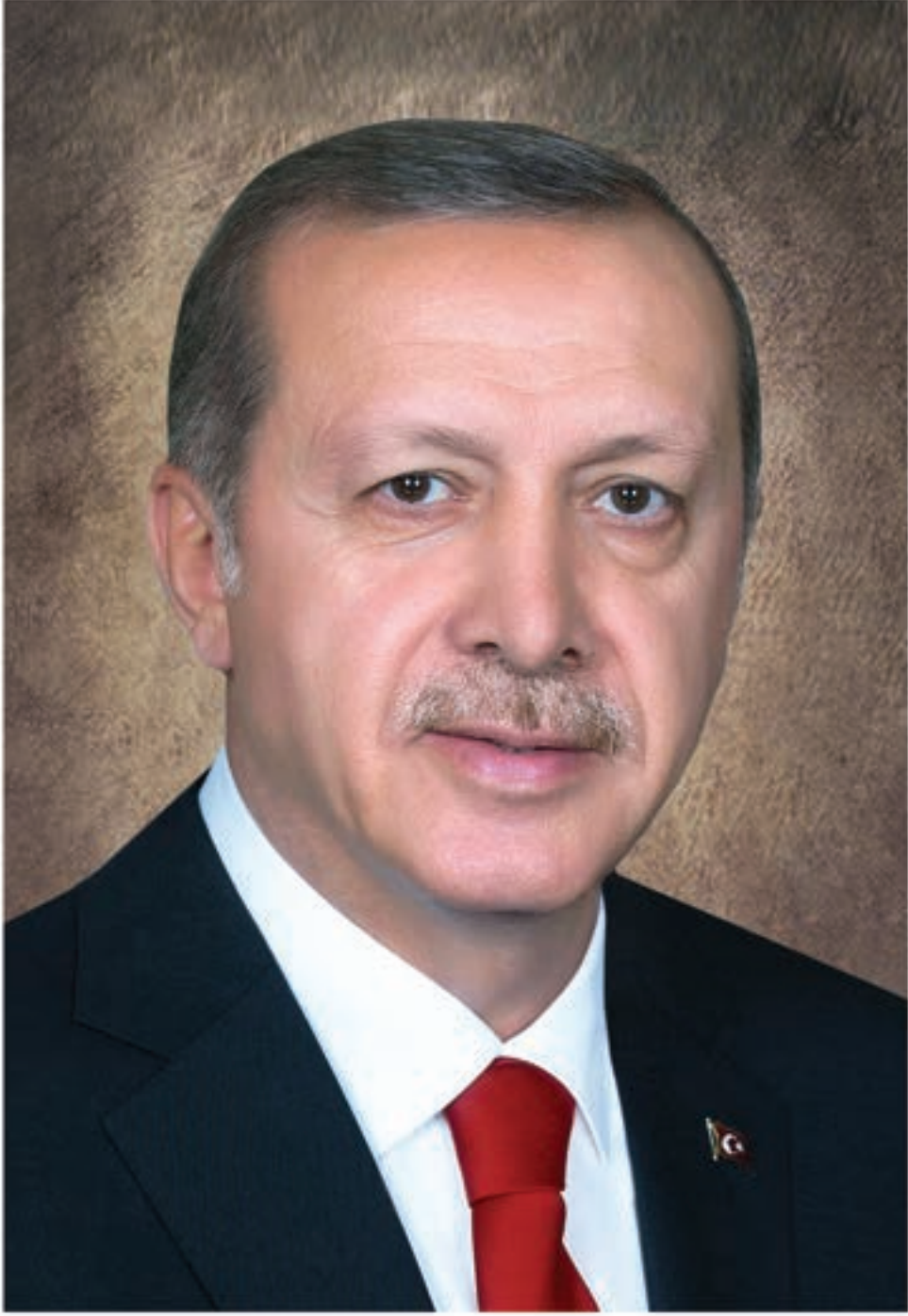
Recep Tayyip ERDOĞAN Türkiye Cumhuriyeti Cumhurbaşkanı