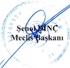
Şenol DİNÇ Meclis Başkanı