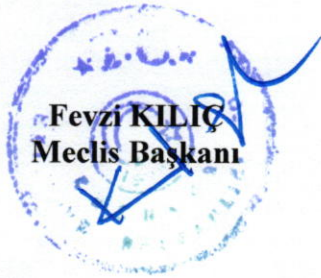
Fevzi KILIÇ Meclis Başkanı