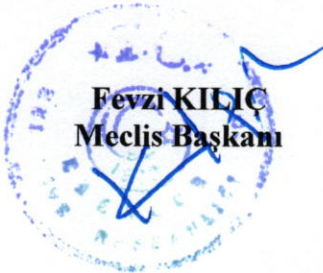
Fevzi KILIÇ Meclis Başkanı