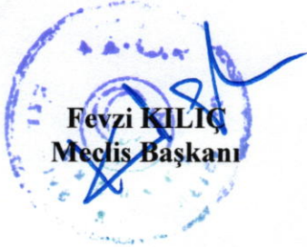
Fevzi KILIÇ Meclis Başkanı